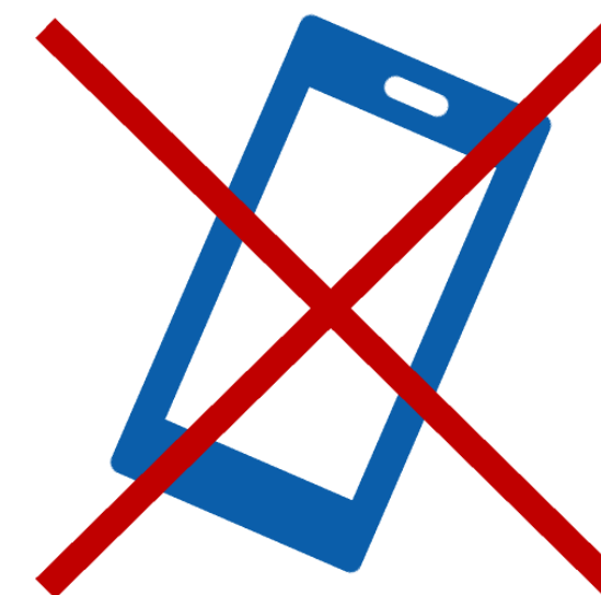
Фото-, аудио- и видеоаппаратуру и иные средства хранения и передачи информации